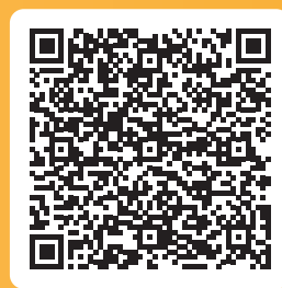
Artikel inför Barnkonventionens dag samt film där några klasser genomför årets uppdrag: https://enbrastart.brynas.se/2019/11/13/2-000-barn-till-monitor-erp-arena-for-barnkonventionens-dag-enda-stallet-i-sverige-som-har-en-san-dag/