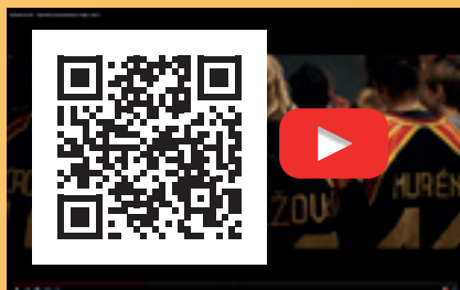
Film om firande av Barnkonventionens dag 2019 i Monitor ERP Arena: https://youtu.be/lyg-qWTKHF4