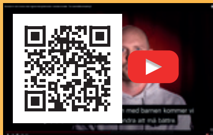
Temat för Barnkonventionens dag var att arbeta för ett mer positivt klimat i sociala medier: www.youtube.com/watch?v=I3mulkae2uw