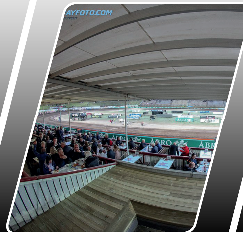
VIP-PLATSER & BILJETTER