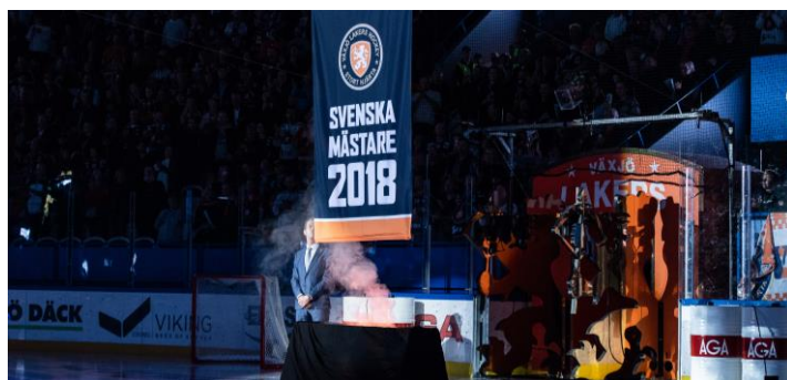
SM-guldflaggan hissades under hemmapremiären i Vida Arena